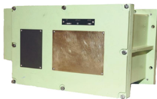
Первичный преобразователь (ППР)